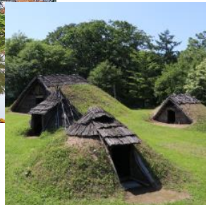
世界遺産 御所野遺跡