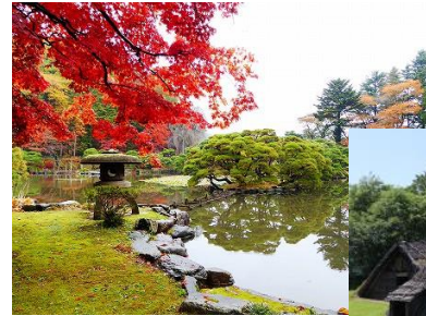
旧南部氏別邸庭園