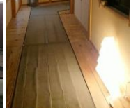
秘湯・祭時温泉かみくら (イメージ)

旅行企画・実施 三八五観光(株)盛岡支店 岩手県滝沢市大釜中道76 TEL 019-656-1385 FAX 019-656-1388 観光庁長官登録旅行業1046号 総合旅行業務取扱管理者 齊藤浩二