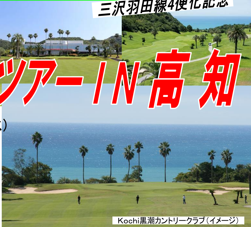
Kochi黒潮カントリークラブ(イメージ)

2022年12月20日(火) ※但し、10組で締め切りとさせていただきます ※お申込み後は、12月22日より取消料が発生いたします。詳しくはウラの取消料をご確認ください。