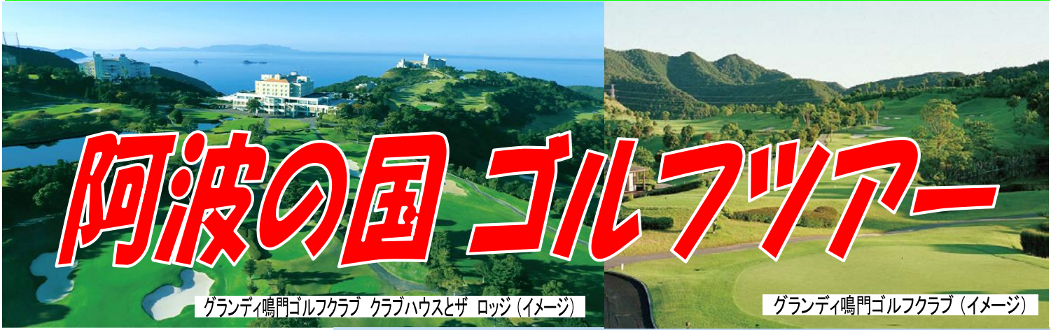
グランディ鳴門ゴルフクラブ クラブハウスとザ ロッジ (イメージ)