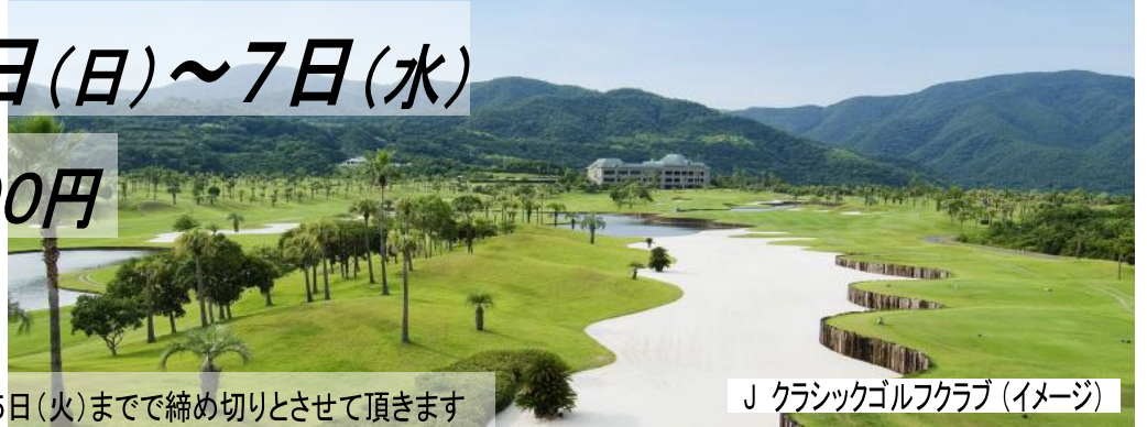
J クラシックゴルフクラブ (イメージ)

申込み締切日 航空機手配の関係上、2021年12月5日(火)まで締め切りとさせていただきます