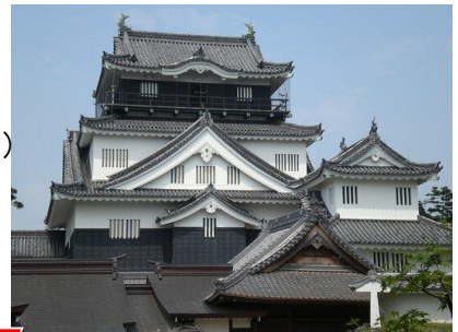
家康が生まれた城 岡崎城