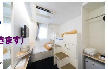
1等クロスツイン(外が見えますよ)