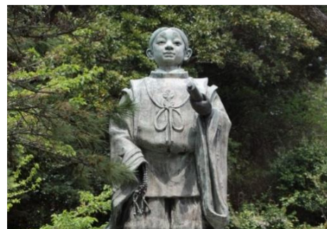
誕生寺 日蓮少年期像