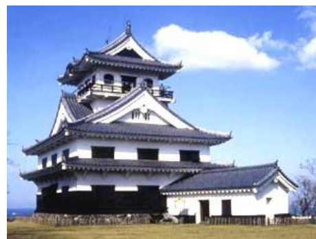
八犬伝の郷 館山城