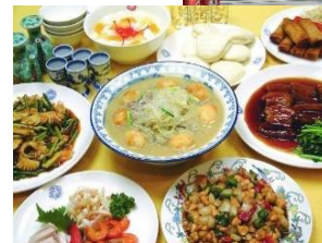
日本三大長崎中華