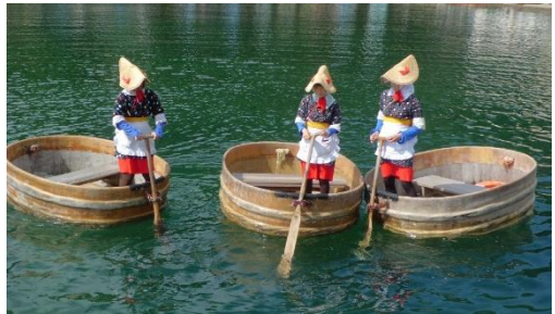
佐渡名物たらい舟

新青森駅発着の方は 2,400円 増し、七戸十和田駅発着の方は 1,300円 増し、大湊線発着の方は 4,700円 増しとなります。 二戸駅発着の方は 2,400円 引き、盛岡駅発着の方は 4,200円 引きとなります。 * ホテルの部屋を1名1室利用の場合は3泊で @16,000円増し となります。 会津若松は全室 1名1室利用 です。 * お一人様での参加の方は @16,000円増し となり3泊とのも1名1室利用となります。