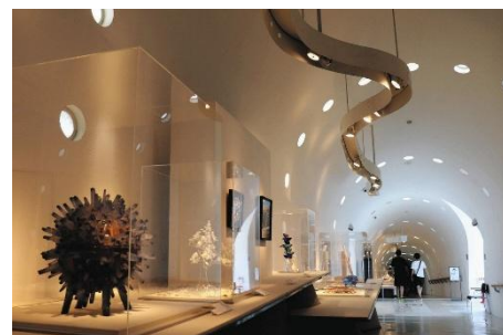
能登島ガラス美術館